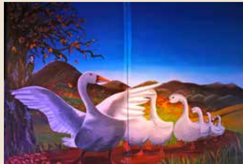
La petite oie qui ne voulait pas marcher au pas , histoire contemporaine française