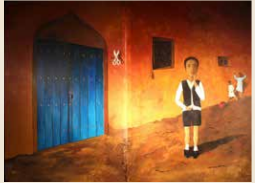
Le Shmatt Doudou , conte juif