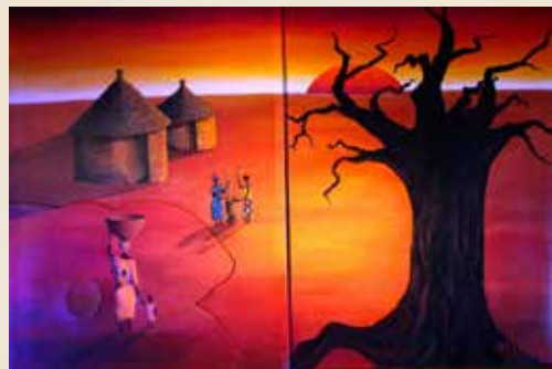
L'aveugle et le chasseur , conte béninois