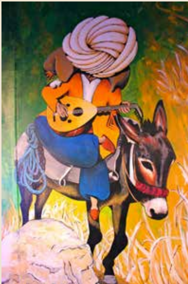
Nasreddine , Turquie