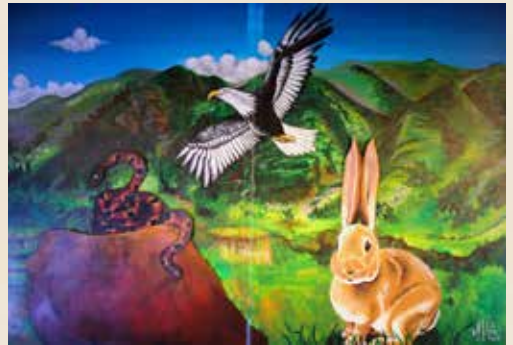
Les oreilles du lapin , conte équatorien