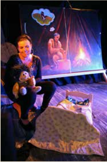
La vieille femme et l'araignée conte Micmac