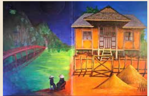
Le marchand de sable , conte chinois