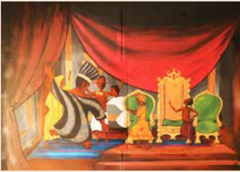
Le plus beau des trésors , conte malgache