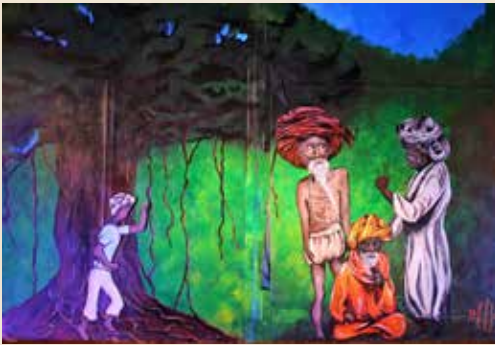
Les 3 siddhus et le disciple , conte indien