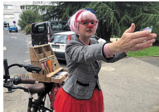
Mme Elsé distribue des dépliants pour informer sur les événements culturels du quartier Port-Boyer.

Une habitante du quartier de Port-Boyer, à Nantes, devient clown tous les vendredis après midi. Elle informe, fait rire. On l'adore.