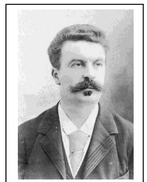
Guy de Maupassant, par Nadar

Une production Cie de l'Yerres - Licence d'entrepreneur de spectacle 2-1060363